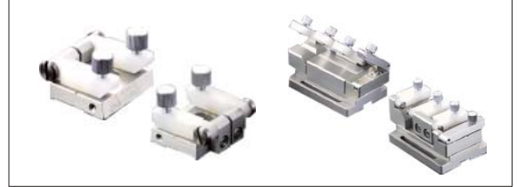
光纤及光线阵列夹具