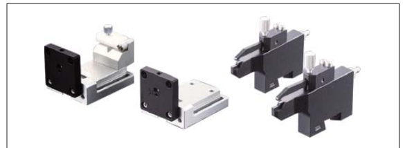
Ferrule 光纤夹具及 GRIN 棱镜夹具