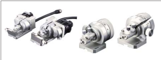
光纤 FC 夹具